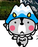
大町市キャラクター 「おおまびょん」