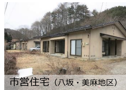
市営住宅（八坂・美麻地区）