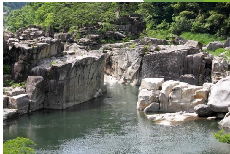
国指定名勝「 寢覚の床 」