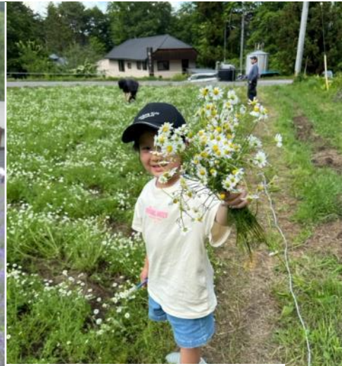
カミツレの里 （カモミール）