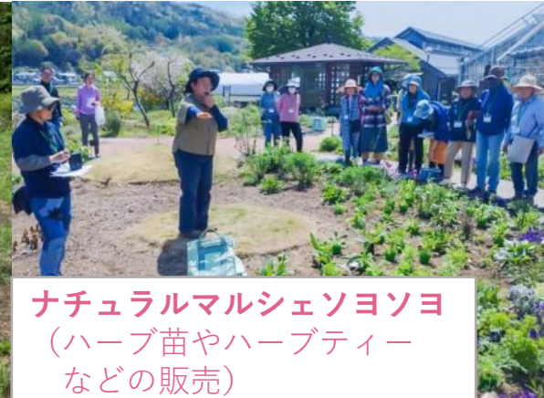
ナチュラルマルシェソヨソヨ （ハーブ苗やハーブティー などの販売）