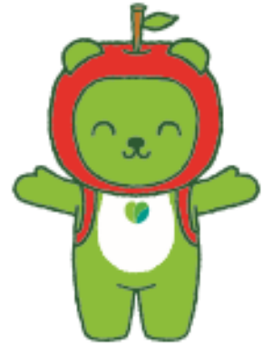
長野県PRキャラクター 「アルクマ」 ©長野県アルクマ