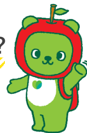
長野県PRキャラクター 「アルクマ」©長野県アルクマ

長野県松本地域の3市5村での、地方暮らしを考えてみませんか？ 先輩移住者や市村の移住担当職員が、松本地域の魅力をお伝えします♪ 移住に関するセミナー、また、 松本地域3市5村 に加えて 就職や住まいに 関する専門家による個別相談会を開催 します！